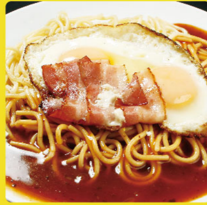
ベーコンエッグ 税込価格 ¥950 ベーコンの目玉焼き