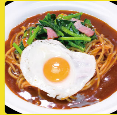
オリーブ 税込価格 ¥1,000 目玉焼き・ほうれん草・ベーコン