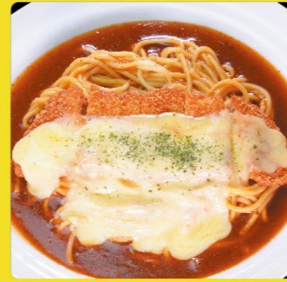
ミラカツ 税込価格 ¥1,030 ポークカツレツ・チーズ