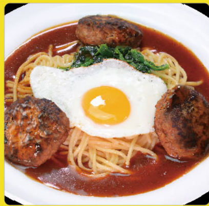
ハンブルグ 税込価格 ¥1,150 自家製ハンバーグ3個・目玉焼き・ほうれん草