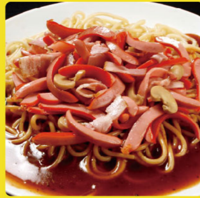
ミラネーズ 税込価格 ¥1,000 ウィンナー・ベーコン・マッシュルーム