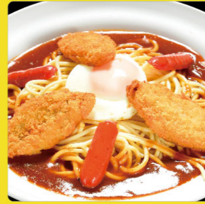
バイキング 税込価格 ¥980 白身魚のフライ・ウィンナー・目玉焼き