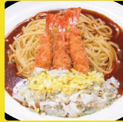
タルタル海老フライ 税込価格 ¥1,100 エビフライ3本・タルタルソース・こし玉子