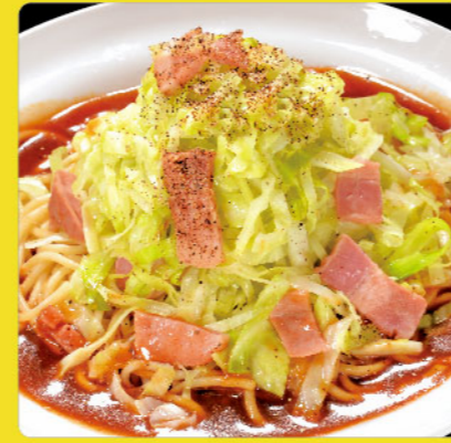
キャベツベーコン 税込価格 ¥980 キャベツ・ベーコン