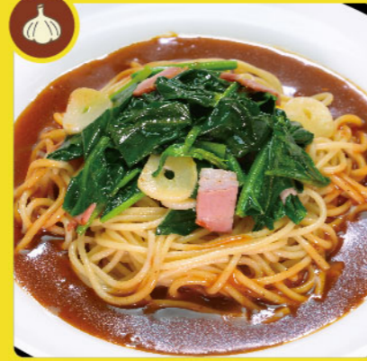
ポパイ 税込価格 ¥1,000 ほうれん草・ベーコン・ニンニク