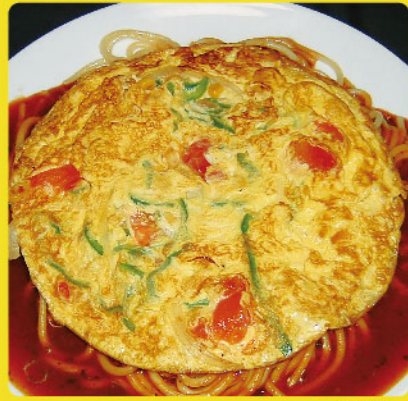
スパニッシュ 税込価格 ¥1,030 オニオン・コーン・トマト・ピーマン入り玉子焼き