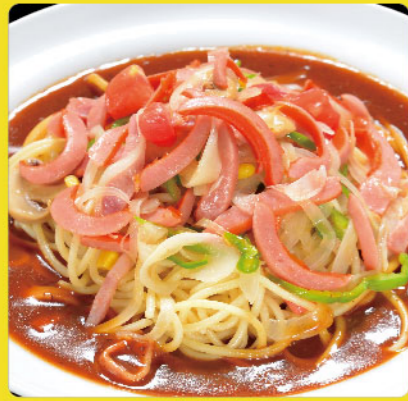
ミラカン(ミックス) 税込価格 ¥1,000 ウィンナー・ベーコン・マッシュルーム・オニオン・ピーマン・コーン・トマト