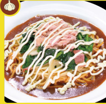
ツナマヨポパイ 税込価格 ¥1,050 ほうれん草・ベーコン・ニンニク・ツナ・マヨネーズ