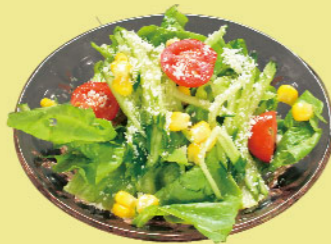
野菜サラダ 税込価格 ¥150 レタス・千切りキャベツ・コーン・トマトのシンプルサラダ