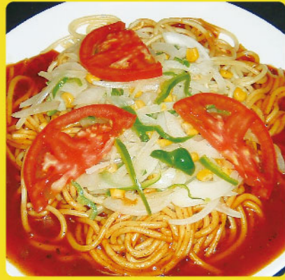
カントリー 税込価格 ¥900 オニオン・ピーマン・トマト・コーン