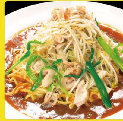
ポークもやし 税込価格 ¥980 豚肉・もやし・にら