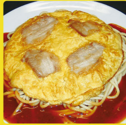
ポークピカタ 税込価格 ¥1,030 豚バラ肉入り玉子焼き