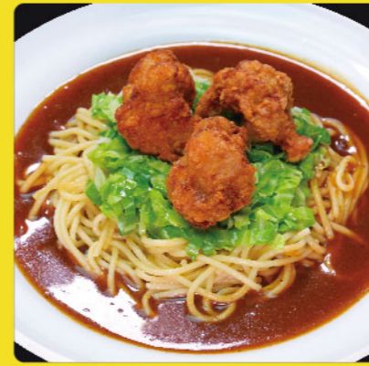
トリカラキャベツ 税込価格 ¥1,000 唐揚げ3個・キャベツ